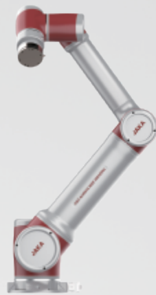
JAKA Zu ® 18s