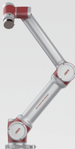
JAKA Zu ® 12s