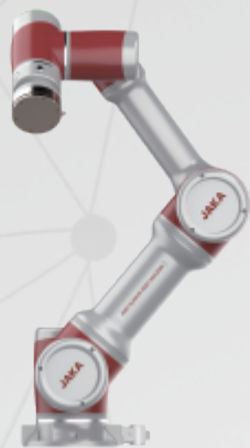
JAKA Zu ® 7s