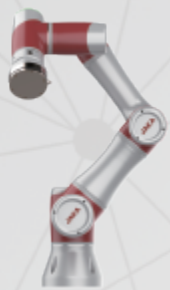
JAKA Zu ® 3s