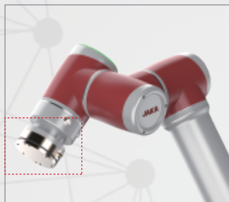
力觉传感器置于末端