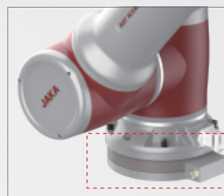
力觉传感器置于底座