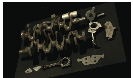
金属工件 (@1.2 m) Mech-Eye Pro M Enhanced