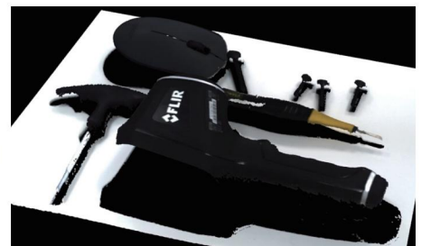
暗色物体 (@0.4 m) Mech-Eye Pro S Enhanced