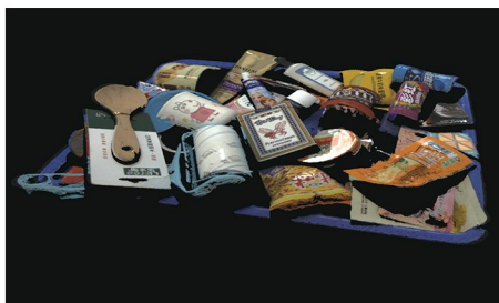
色彩鲜艳的货品 (@1.2 m) Mech-Eye Pro M Enhanced