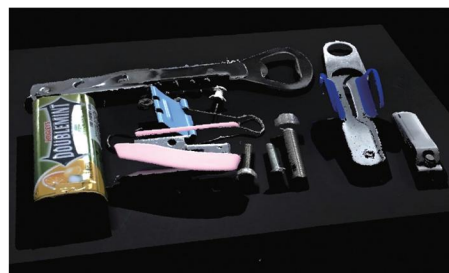
一定程度反光的物体 (@0.4 m) Mech-Eye Pro S Enhanced