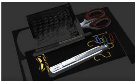
细节丰富的文具 (@0.7 m) Mech-Eye Pro S Enhanced