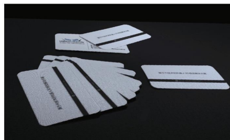
名片 (@0.7 m) Mech-Eye Pro S Enhanced